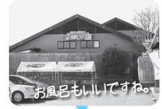
安眠の湯 → 10時15分着