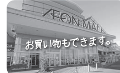
イオンモール太田 → 10時18分着

9時30分発の路線バスに乗ると、店の開店する10時ごろには到着。帰りは、イオンモール太田発14時33分に乗ると、15時5分に終点の邑楽町役場に到着します。明るいうちに帰ることができるので、子どもにも安全ですね。