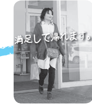
イオンモール太田 → 14時33分発