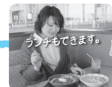
お風呂に入ったり、買い物したりして楽しむことができます

9時30分発の路線バスに乗ると、店の開店する10時ごろには到着。帰りは、イオンモール太田発14時33分に乗ると、15時5分に終点の邑楽町役場に到着します。明るいうちに帰ることができるので、子どもにも安全ですね。