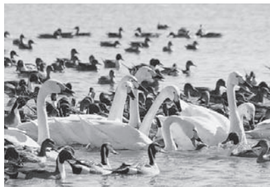
大人気の白鳥まつりも今年で10回目を迎えます。毎年、白鳥をひと目見ようと、多くの来場者でにぎわいます

邑楽町白鳥を愛する会では、第10回白鳥まつりを開催します。皆さん、ふるってご来場ください。 ▼期日/時間 1月29日(日)/午前11時～ ▼会場 ガバ沼駐車場(中野沼東側) ※駐車場は中野沼、県緑化センター、多々良沼公園の駐車場をご利用ください。