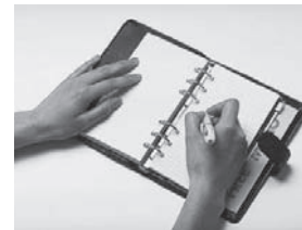
調査内容の秘密は、統計法に基づき固く守られています

▼問合先 役場企画課 47-5010 ▼調査結果の活用 各種行政施策をはじめ、地域の産業振興や、商店街の活性化対策に活用されます