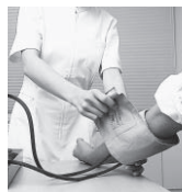
看護の現場で働きたいと思っている人の再就業を支援する講習会です