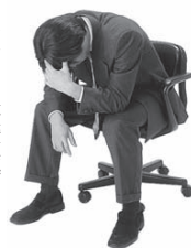
一人で悩まずご相談を