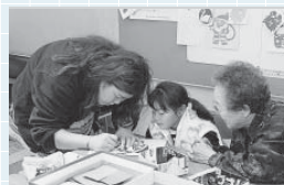
体験コーナーも楽しいよ