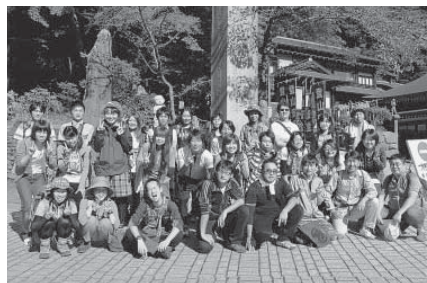
パワースポットと一緒に散策しよう(昨年のツアーから)

■教室・講座などの申し込み方法 ▼申込開始当日 申し込み開始時間に申込先の窓口に、本人または家族の人が直接申し込んでください。