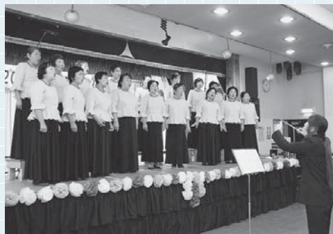
心を込めて歌います (昨年の文化祭から)

邑楽町文化協会では、邑楽町民文化祭を開催し ます。町内のさまざまな文化団体が一年の活動 の成果を発表する文化の祭典。舞台発表・作品 展示・模擬店など、参加団体が年々増加し、ま ます内容が充実しています。来て見て触れて 文化の薫りと情熱を体感してください。皆さん のこ来場を会員一同お待ちしております。