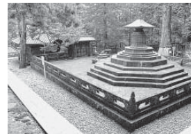
現在の日光東照宮奥社境内(元多宝塔跡の現宝塔側から拝殿方向を望んだ全景)

徳川将軍家初祖、家康公の21回神忌に向け、祖父家康に心酔する3代将軍家光公によって寛永13年(1636)に大造替されたその成果が、現在の日光東照宮に伝わる社殿群です。この造替で不用となった元和創建東照宮の施設のうち、奥社の多宝塔・拝殿が、寛永19年(1642)に日光から世良田の地へ移築され、世良田東照宮の本地塔・拝殿として復活したのです。