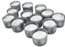
おいしいカップケーキ作り挑戦