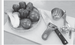
初心者のかた大歓迎