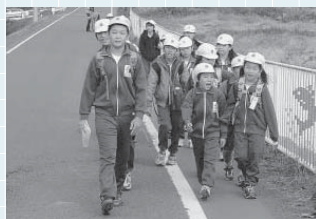
長いコースの間には笑顔がたくさん

中野小学校では、1年を通じて 回分けをし、いろいろなふれあい 活動をしています。すべての学年 を赤・青・黄・緑の4つの回に分け、 さらに各回を小さい班に分け、1 年生から6年生までが交流を図り ながら一緒に遊びます。