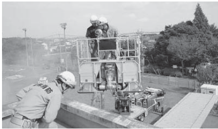
高層建物救出救助訓練 (一昨年の防災訓練の様子)