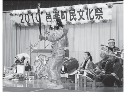
昨年の町民文化祭では、里神楽9演目の内の「天の岩戸開きの舞」を披露

■将来の夢はなんですか？ 以前、原材料の輸出入管理で、外国の現地人と電子メールでやりとりをしていたこと。なんと、取引相手のインド人から、結婚式へ招待されました。後日、写真付きの報告メールまで届いてびっくり。このときは素直にうれしかったです。仕事にとてもやりがいを感じました。こういった信頼関係をたくさん築けるよう、今後も自己のスキルアップを目指していきたいです。