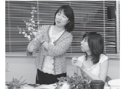
生徒さんには、心を豊かにする花の魅力を知ってほしいです