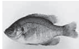
放流や飼育が禁じられている特定外来生物のブルーギル

現在の多々良沼は何か最悪期から脱出したと思われず。そして奇妙なことに、生息する魚の種類が70年程前の正常期とほぼ同じ20種前後です。この不可思議な現象は、構成魚種を見ると分かります。正常期はほとんどが在来種でしたが、今では6割以上が外来種となっています。環境の悪化は、永らく生息してきた貴重な在来種の多くを奪い去り、そのすき間は魚社会に大きな混乱をもたらしているブルーギルなどの外来種で満たされているのです。