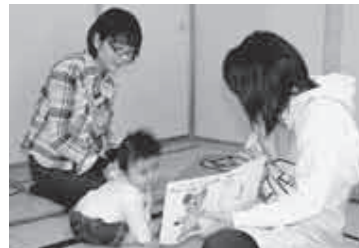
絵本との出会いをお手伝いします

町立図書館では、4月14日、邑楽町で子育てをしている人を対象に、読み聞かせボランティア・保健センター・地域子育て支援センター (中央保育園・風の子保育園) の職員と協力し、8か月児健診に合わせて、親子に絵本を配布するブックスタートを行いました。ブックスタートとは、親子が絵本の読み聞かせを通し、温かくて楽しい時間をつくるための事業です。ぜひ、子どもさんに優しく語りかけ、絵本を読んであげて、楽しい時間をお過ごしください。