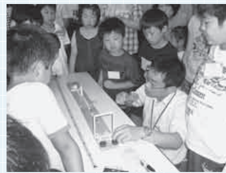
楽しみながら科学を探究していきます

長柄公民館では年3回「おもしろ科学教室」を開催しています。伝統的なこの教室も毎年多くの子どもたちが参加し、実験や工作など自ら体験することを通して科学に対する興味や関心を高めています。毎回講師の皆さんが工夫を凝らして熱心に指導。お友達と一緒に楽しく、分かりやすく学べます。私たちの身の回りには科学の疑問がたくさん。そんな疑問を科学教室で探究していきます。楽しい実験にチャレンジしたい子どもたちをお待ちしています。