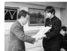
邑楽南中学校生徒会