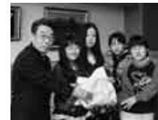
長柄小学校児童会本部役員

3月25日、邑楽南中学校生徒会、3月30日には長柄小学校児童会の本部役員の皆さんが、義援金を町に手渡ししました。少しでも自分たちのできるこ