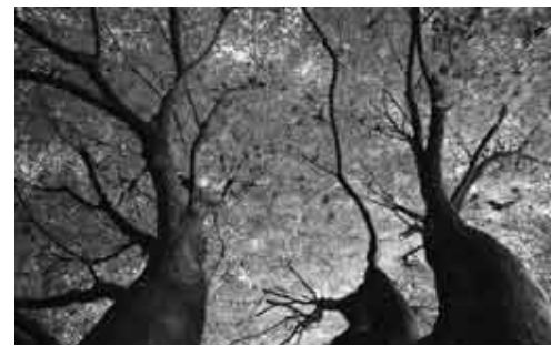
森のある場所 Forest Place