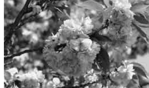
緑のある場所 Green Place