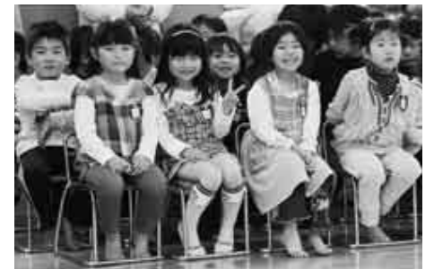
次世代の社会を担う子どもを社会全体で応援します