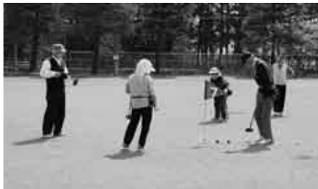
グラウンド・ゴルフを楽しむ高齢者