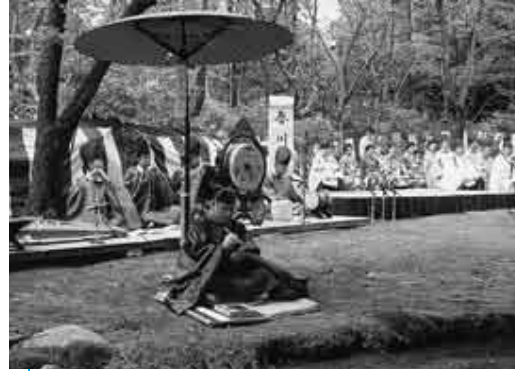
源氏千年記にあたる2008年、歌人として京都上賀茂神社の曲水宴に参加

私が源氏物語の研究を本格的に始めたのは、高校の教師を退職してからです。簡単に達成できないような遠い目標に、意を決して取り組みたいと思ったのです。源氏物語は、紫式部著の54巻からなる日本最古の長編小説であり、文学史上最高の傑作。日本が誇る世界的財産です。物語を原文のまま古典の文法・語法に忠実にのっとり正確に読み進め、解釈する作業に取り組みました。この基