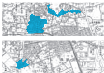
…今回追加された供用開始区域