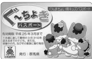
ぐんまちよい得キッズパスポート