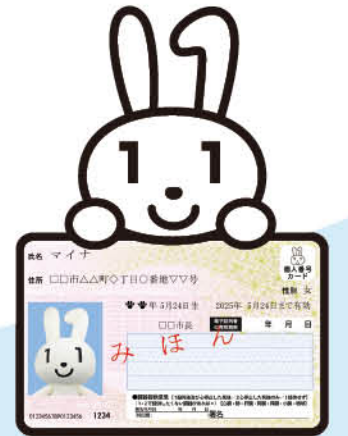
マイナンバーPRキャラクター マイナちゃん

マイナンバーカードは本人確認書類として利用できるほか、自治体サービスやe-Taxを利用した電子申請など、さまざまなサービスに利用できます。今後さらに利用できることが増えて、ますます便利になっていくマイナンバーカード。まだ持っていない人はこの機会にぜひつくってみてはいかがでしょうか。