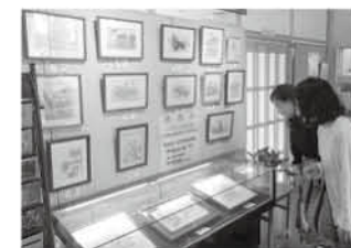
展示中の絵画をお楽しみあれ

長柄公民館 ミニミニギャラリーへいらっしやい! 楽画会の作品が皆さんを待っている 長柄公民館ミニミニギャラリーのお知らせです。ギャラリーでは今、楽画会の皆さんの作品を展示しています。水彩色鉛筆を使い巧みに豊かな色彩の絵を描いている楽画会。優しく柔らかな雰囲気を出した作品を見て和やかな気持ちになっけてきます。この展示は6月30日④まで行っています。ぜひ皆