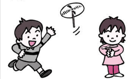
どうやって回したらもっと高く飛ぶのかな

期 7月23日④ 時 午前10時~正午 場 長柄公民館 内 竹とんぼの作り方と飛ばし方を学ぶ 対 小学生(1・2年生は保護者同伴) 定 15人(先着順) 費 300円(材料代) 申 7月2日④午前10時から 問 長柄公民館