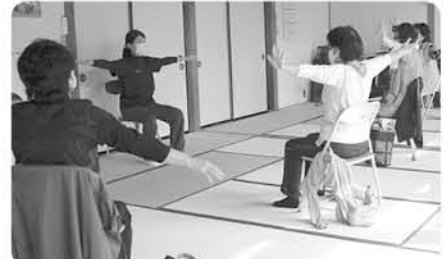
健康体操で筋力アップ! 腕もしっかり鍛えます

期 7月12日④、26日④、8月9日④、23日④、9月6日④、20日④、10月4日④、18日④、11月1日④、15日④(全10回) 時 午前10時~11時30分 場 2区公民館 内 脳トレや健康体操、給食センター見学など、暮らしに役立つ知識を学ぶ 対 18歳以上の人 定 15人(先着順) 費 実費 申 6月28日④午前10時から 問 生涯学習課