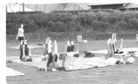
早朝のヨガで心も体もリフレッシュ

期 7月27日④、28日④、29日④(全3回) 時 午前6時30分~7時15分 場 松本公園(雨天時は高島体育センター) 内 屋外でストレッチとヨガを行う 定 50人(先着順) 費 無料 申 6月22日④午前10時から 問 高島公民館