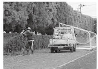
スポレク広場、防除完了!

町民体育館 暑くなってくる季節、あちらこちらで害虫が 気温の上昇とともに、屋外体育施設の樹木には害虫が発生し始めてきます。それを未然に防ぐため重要な手段となるのが、殺虫剤による防除です。町民体育館では毎年5月中旬頃から2、3度、害虫防除のために殺虫剤の噴霧作業を行っています。利用者みなさんが安心して利用できるように、今後も目を光ら