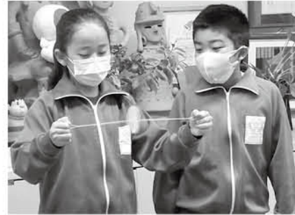
ぶんぶんどまの遊び方をリモートでレクチャー

ピッカピッカの1年生たちは手作りのプレゼントをもらうことができ、大喜びしたでしょう。優しいお兄さんお姉さんに温かく迎えられる、不安は吹き飛んだと思います。新しいメンバーも加わったので、いじめのない明るく楽しい長柄小学校をますます成長させてください。