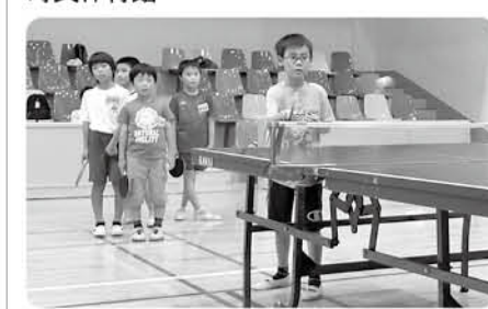
コーチの球を打ち返すために集中!

期 7月26日④、27日④、28日④、29日④(全4回) 時 午後6時30分~7時30分 場 町民体育館 内 卓球を基礎から学ぶ 対 小学生 定 20人(先着順) 費 500円(保険代) 申 6月25日④午前10時から 問 町民体育館