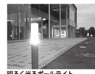
明るく光るポールライト

中央公民館 ポールライトの存在を忘れないで! 近くで遊ぶときは要注意 暗くなると中央公民館の庭をオシャレに照らしてくれるポールライト。このライトはガラスでできていて、衝撃が加わると割れてしまうので、ご注意ください。皆さんポールライト付近で遊ぶときは十分に気をつけてください。もし割れてしまったら危険ですので、触らずに職員に知らせてください。