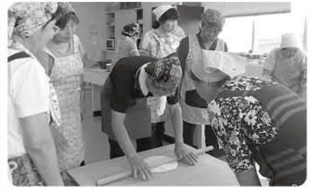
寝かせうどんをのぼして、おいしくなあれ

期 7月2日④ 時 午前9時~午後1時30分 場 長柄公民館 内 手打ちうどんと冷や汁の作り方を学ぶ 対 18歳以上の人 定 10人(先着順) 費 800円(材料代) 申 6月18日④午前9時から 問 長柄公民館