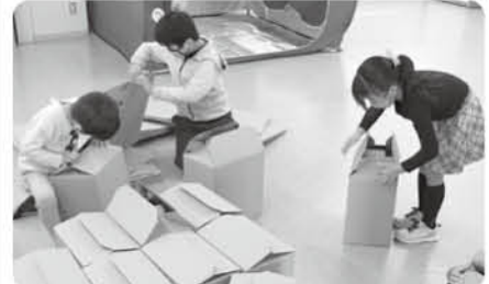
段ボールベッドを組み立てて予習ばっちり