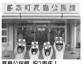
高島公民館、祝2周年!

高島公民館 名称が変わって2年が経過 高島公民館をどうぞよろしく 「勤労青少年ホーム おうらヤングプラザ」から「高島公民館」に名称が変更されました。そのことを広報おうら令和2年4月号5分の4ニュースでお知らせ。それ以降、多くの人から利用の問い合わせをいただいています。しかし、いまだに「ヤングプラザ(ヤングプラザ)ではないの?」とのお声があります。いかに「ヤングプラザ」が皆さんにとって身近で親しみやすい存在であったか実感しました。高島公民館も早く覚えてもらい、変わらず良い存在であり続けます。