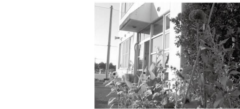
建物の南側は日当たり抜群

長柄公民館 隠れた名所、長柄公民館の窓から 華やかな植物たち 長柄公民館の数々の植物を眺めたことありますか？ 駐車場や玄関が建物の北側のためか、意外と知られていないようです。建物の南側に回ってみてください。四季折々のさまざまな植物が植えられています。 今でもアサガオが咲いています。中庭ではモミジが色づき、ネーブルがたくさんの実をつけてきました。これらは利用者の皆さんが「少しでも公民館を華やかに」と自主的に植物を植えて、管理してくれているものです。 建物の南側は日当たり抜群