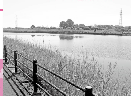
マミズクラゲが生息する中野沼西沼(釣り禁止)

一年越しの片思い 諦めなくてホント、良かった 2017年は、多い日で100匹のマミズクラゲが確認されました。2018年は30匹、2019年は10匹...。このように確認数は年々減り続けていました。そして2020年、10月末までほぼ毎日欠かさず現地での調査を続けましたが、一匹も確認することはできませんでした。 期待を込めて、いざ調査 2021年8月、例年と同じように調査を開始。「今年はずっと確認する」と意気揚々と調査をするものの、いつになっても発見の兆候は見られず...。「今年も会えないかな、どうして姿を見せられないのかな」と、ため息交じりの調査が続きました。 しかし、そんな調査が日課となっていた9月15日、発見することができたのです。その数、約10匹。 気温や水温の影響 マミズクラゲが発生する そこでは、昨年と今年の7月の気温を比較してみました。すると、最高気温が30度を超えた日(真夏日)の日数に違いがあることが分かりました。昨年の真夏日は5日しかありませんでしたが、今年は7月中旬以降、毎日のように真夏日が続きました。このことが今年のマミズクラゲの発生につながったのではな また来年 北極と南極以外の世界中に分布しているマミズクラゲは、環境を整えば、水たまりなどにも出現するようです。とは言え、1997年から断続的に確認されている中野沼西沼のように、同じ場所でも発生している状況は非常に珍しく、マミズクラゲの定着に適する豊かな環境を保持しているとされます。まだまだ謎が多いマミズクラゲ。調査は来年も続けます。