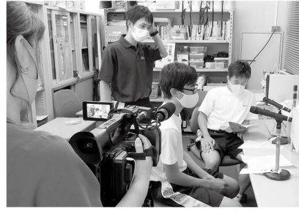
放送室から各教室へ語りかける生徒会本部役員

楽しいはずの給食の時間が、黙食になって1年以上が過ぎました。どこの学校でも同じように全員前を向いて、おしゃべり禁止の時間を過ごしていると思っていました。『ラジ邑楽』はラジオを楽しんで、流れてくる言葉からいろいろイメージを膨らませる良い経験となると思います。