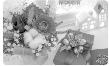
季節の花でクリスマスをにぎやかに(イメージ)

期 12月21日(金) 時 午後7時～8時30分 場 中央公民館 内 オアシスを使って、季節の花をクリスマス風に飾る 対 女性 定 15人(先着順) 費 2,000円(材料代) 申 11月16日(土)午後7時から 問 中央公民館