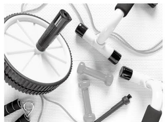
健康づくり器具の例(イメージ)