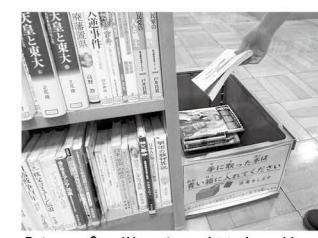
「やっぱり借りない」は青い箱へ

町立図書館 町立図書館の感染症対策 一度手に取った資料は青い箱へ 新型コロナウイルス感染症の対策として、一度手に取った本やCD、DVDの空ケースなど(以下、資料)の全てに消毒作業を行っています。 新聞コーナーのテーブルや新刊雑誌のカバー、記載台や鉛筆といった人の手指が触れる場所や物も消毒作業を行っています。皆さんが安心して利用できるように努めています。 新しい資料は手に取って借りない資料は棚に戻さず、近くの青い箱に入れてください。巡回する職員が回収し、消毒作業をしてから元の棚に戻します。 新聞コーナーのテーブルや新刊雑誌のカバー、記載台や鉛筆といった人の手指が触れる場所や物も消毒作業を行っています。皆さんが安心して利用できるように努めています。