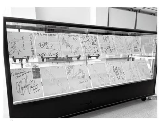
ずらりと並ぶ著名人の直筆サイン

中央公民館 色紙がいっぱいになるくらい さまざまなイベントで盛り上げます 中央公民館では、毎年さまざまなイベントで著名人がたくさん訪れます。そのときは、来館の記念として直筆のサインをいただきま す。これまで事務室で保管していたサインですが、利用者の皆さんにもご覧いただけるように、エントランスロビーに展示することにしました。その数現在14枚。ご覧いただくと「えっ、こんな人が来ていたんだ！」と驚くかもしれません。 今後もさまざまなイベントを企画し、著名人から欠かさずサインをいただきます(笑)。