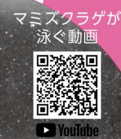
マミズクラゲが泳ぐ動画