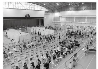
集団接種会場(10月9日撮影)

町民体育館 ワクチン接種会場の利用は終了 11月から通常通りの利用案内に 8月から新型コロナウイルスワクチン集団接種のための会場として使用してきた町民体育館。この会場で10月までに9,893回分の接種が行われました。集団接種が一段落したことから、11月からは通常通り利用いただけるようになりました。 接種会場としていた期間中には、いくつもの利用団体の皆さんに会場変更の調整を受け