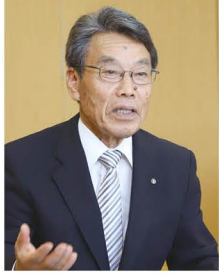
邑楽町長 金子正一

現在、変異株の広がりなどで、全国的に新型コロナウイルス感染症の急激な感染拡大が続いています。この変異株は、従来比較的感染しづらいとされてきた若年層にも強い感染力を持つとされており、当町