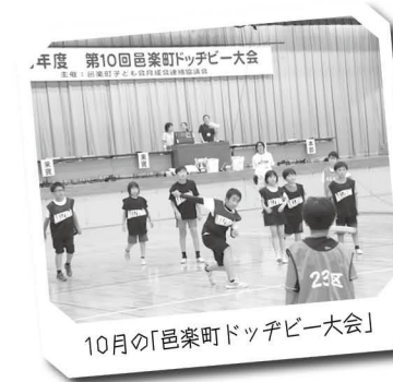
10月の「邑楽町ドッチビー大会」

県内では各自治体に子育連が設置されていて、活動を行っています。町では、各行政区の育成会から推薦を受けた人が子育連の本部役員として会を運営しています。