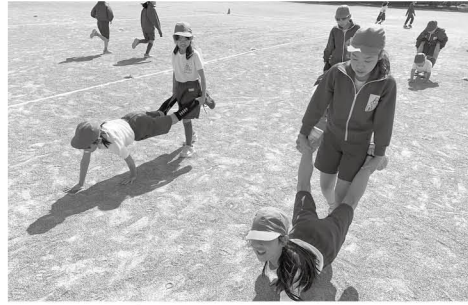
手押し車。前だけでなく後ろや横にも進みます

高島小学校の朝の行事「トレーニング」は、平成25年から取り組んだ体力向上の一環で始まったことだと思います。年間を通して学年ごとに内容を変え、みんなで競うように取り組む姿勢はとて素晴らしいです。「はやね、はやおき、あさごはん」に加えて「サーキット」で汗を流し、笑顔あふれる充実した毎日になりますね。