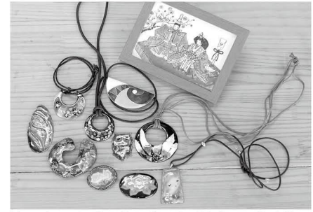
焼き時間や温度で色や光具合が変化する七宝焼き