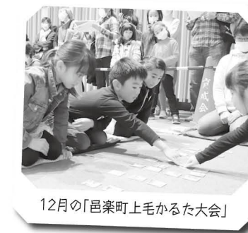
12月の「邑楽町上毛かるた大会」

本部役員は毎年、各学区から2人ずつ選出され、任期は2年です。そのため常に、合計16人の本部役員がいます。