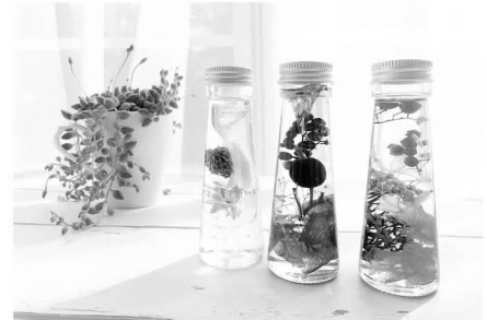
インテリアに人気のハーバリウム(イメージ)