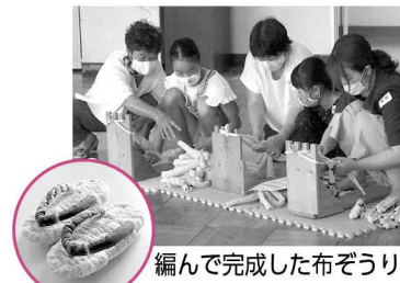
編んで完成した布ぞうり

参加者からは「タオルを編むところや鼻緒を縫うのが難しかったけど、とても楽しかった」などの感想を聞くことができました。