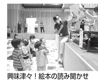
興味津々! 絵本の読み聞かせ

教室でよくぞく開催! 足元快適、親子布ぞうり作り教室 長柄公民館では、小学生とその保護者を対象にタオルを使った「親子布ぞうり作り教室」を行いました。教室では専用の器具を使って、ひも状にしたタオルをぞうりの形に編んでいきました。初めは慣れない作業に悪戦苦闘の様子でしたが徐々に慣れていき、最後には涼しげな布ぞうりを完成させることができました。