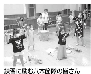
練習に励む八木節隊の皆さん

全ての垣根を越えて ヨーロッパ生まれのスポーツ「ポッチャ」 町民体育館では今年、パラスポーツの普及を目標として教室を計画しています。教室開催の際は、ぜひ参加してください。