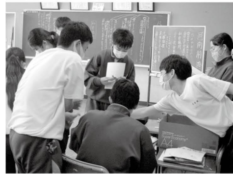
学校生活の充実のために自発的に行う生徒会活動

邑楽南中学校生徒会は、年間を通してボランティア活動を実践して成果をあげています。生徒会活動が盛り上がるのも応援してくれる生徒や先生、そして地域の人たちの協力があるからだと思います。「次は何ができるか」「何に挑戦しようか」と思い巡らせることは、邑楽南中学校の伝統ですね。見守っていますので、頑張ってください。