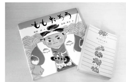
「ももたろう」と「桃太郎の誕生」

口から耳へ。昔話を聴く機会はめっきり減りましたが、絵本にその「声の文化」は受け継がれています。絵本の思い出には、きっと声の響きが混じっていることでしょう。