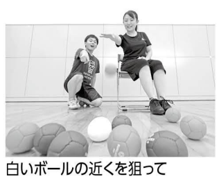
白いボールの近くを狙って

町民体育館では、今年、パラスポーツの普及を目標として教室を計画しています。教室開催の際は、ぜひ参加してください。