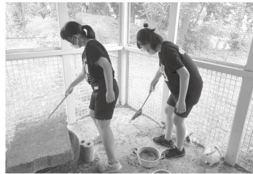
うさぎが快適に過ごせるように、掃除は念入りに

中野東小学校のうさぎ小屋は、1・2年生の教室の近くにあります。休み時間にはかわいい顔を見せて、多くの子どもたちが癒されていると思います。飼育委員の皆さんは小屋の掃除をしたり、うさぎの健康状態を見たりして、動物の命を大切にすることを教えてくれています。低学年の児童にとっては大きな学びです。飼育委員の皆さんに感謝します。