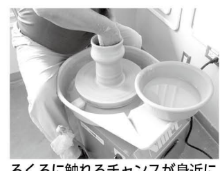
ろくろに触れるチャンスが身近に

長柄公民館 直射日光を遮る万能カーテン 琉球アサガオグリーンと成長中 長柄公民館の南側には緑のカーテンのネットがあります。ネットは2階にある和室のベランダから1階のホール窓を包み込むように張ってあります。緑のカーテンとして植えてあるのは琉球アサガオという生命力の強いアサガオです。梅雨時期の雨でより一層成長しました。今では夏の太陽を浴び、さらに元気に成長し、窓を