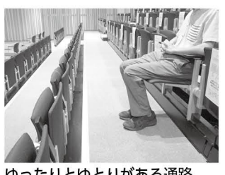
ゆつたりとゆとりがある通路

中央公民館 少しでも快適に邑の森ホールのちよつとしたこだわり 今回は邑の森ホールのちよつとしたこだわりを紹介します。皆さんは映画館などに行ったとき、自分の座席の列の手に人が座っているのを見て、通路幅を通常より広くすることによって、人が座っていても、前にはゆつたりとゆとりがあるのでお互い気持ちよく利用できるんです。その他にも、邑の森ホールには、ちよつとしたこだわりがたくさんあります。ぜひ、探してみてください。