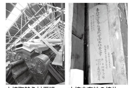
大棟取替え材仮組 大棟内奉納の棟札

陽明門と本殿・石の間・拜殿の二棟を対象とした今回の工事は、昭和の大修理以降およそ50年が経過した外部装飾(漆塗、彩色、鋳金具)の全面更新を中心に、剥落の進行が顕著な一部室内障壁画の剥落止めの他、屋根や木部の腐朽・破損箇所を限定した修理方針に基づき、7年間にわたって実施されました。本殿の屋根銅板葺は、明治後年の大修理で全面葺き替えられたことが史料から確認されていましたが、既に100年以上が経ち、この間一度も葺き替えが行われていない点から、念のため最も雨漏りのリスクが高い屋根頂上や谷筋