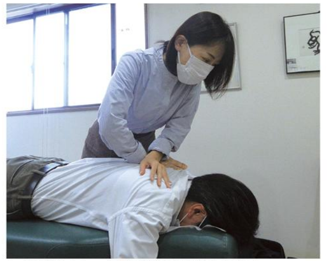
カイロプラクティックは体を自然な機能に戻します

問題は変化します。そのため、お客さんには生活習慣のチェックをしてもらうことを心掛けています。体は買い替えのできない財産です。私たちは、今ある自分の体を生涯使い続けていくし、かありませぬ。メンテナンスを重ね、良い状態を保つことが必要なのです。