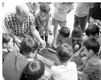
英語を交えた模擬実験に取り組む活動も(昨年の様子)