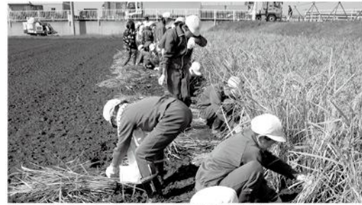
たわわに実った稲を次々と刈り取る子どもたち

5年生の稲作体験では、泥の中での田植えや鎌を使っての稲刈りなど、普段は経験することのできない貴重な体験ができました。米作りの大切さやおいしいお米を作る工夫などに、興味が膨らんでいるようです。今後も作物を育てることに興味を持ち、考えを深めてほしいです。