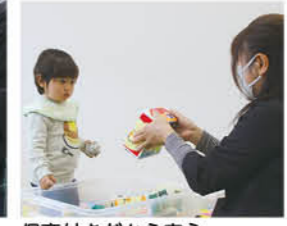
保育付きだから安心

前から保育付きの教室が気になっていました。教室のようすが分かる写真が掲載されて、次回も参加してみたいと思いました。