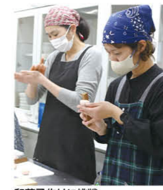
和菓子作りに挑戦

俳句、短歌をいつも楽しみに読んでいます。投稿された人たちの日常が垣間見られて、おもしろみがあります。