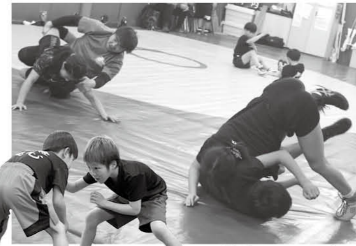
邑楽ジュニアレスリングクラブ

少子化に加えて、スポーツ種目や習い事の多様化などの影響を受け、団員数が減少しています。コロナ禍もその傾向に追い打ちをかける形となってしまいました。しかし、邑楽町では各単位団がそれぞれ工夫を凝らし、楽しく元氣な活動を団結して頑張っています。 精神的にも、身体的にも発達段階にある年代の子どもたち。スポーツを通して心身を育み、交友関係を広げることは、子どもたちの健やかな成長につながります。3月30日まで体験会を開催しているので、お気軽に参加してみてください。