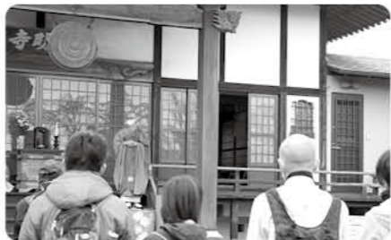
住職から永明寺についてを教わる

期 4月6日⑤(雨天決行) 時 午前8時30分受付開始、9時出発 内 邑楽町の七福神を中心に道中の自然と文化財を巡る(距離約23km) 対 どなたでも 持 弁当、飲み物、雨具など 費 100円(保険代) 申 当日会場で申し込む(シンボルタワー集合) 問 中央公民館