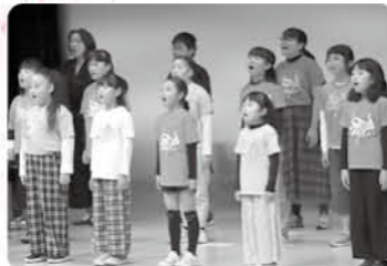
邑の森ホールで歌声を披露するSING!