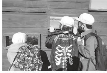
柵の窓から白鳥に見つからないように観察中

伝統ある白鳥オリエンテーリングが開催できてよかったです。縦割り班で学びあい、楽しみながら散策行動、すてき！しかも飛来した白鳥を見られるとはラッキーですね。この行事がずっと続くことを私も願っています。