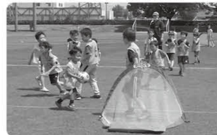
基礎をいっから、サッカー上達を目指して

期 5月11日⑤、18日⑤、25日⑤(全3回) 時 午前9時30分～11時 場 スポーツ・レクリエーション広場、他 内 サッカーの基礎を学ぶ 対 年中から小学3年生 定 30人 費 500円(保険代) 申 4月13日⑤午前9時30分 問 町民体育館