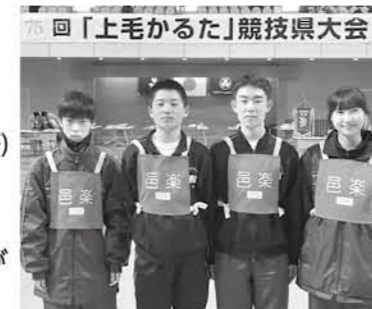
県大会に出場した天王元宿子ども会

2月12日、第75回「上毛かるた」競技県大会が行われました。 中学校団体の部予選リーグ 第3位 天王元宿