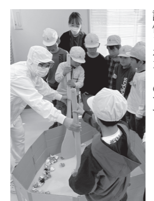
給食の作り方を説明する調理員

町立学校給食センター(以下、給食センター)が県教育委員会学校給食優良学校等表彰を受賞しました。これは学校給食の普及と充実を図るために、優秀な成果をあげた学校および共同調理場を表彰するものです。 給食センターは町内の小中学校や幼稚園で食に関する授業を行う他にも、動画制作やオンライン会議システムを利用した給食センター見学など、学校と連携したICT活用による指導を行っています。