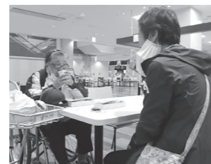
▶買い物終わりにみんなでご飯