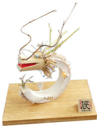
邑楽町の年男・年女(辰年生まれ)の人口 (令和5年12月18日現在)

2024年は「辰年」。そして生まれた年と同じ十二支を迎える人を年男・年女と呼び、とても縁起が良いといわれています。新年を迎え、気持ちも新たに町内の年男・年女の人たちに今年の目標を聞きました。