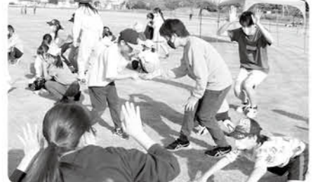
じゃんけんでどんでん動物を進化させていこう

期 10月29日(日) 時 午前9時30分～午後3時30分 場 おうら中央多目的広場 内 レクリエーションゲームなどをする 対 小学生 定 100人 費 100円(保険代) 申 当日会場で申し込む 問 中央公民館