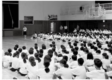
発言も聴く姿勢も、雰囲気よく開催された生徒総会

「性差のある校則」を生徒総会で意見を出し合い、良い方向に改変できたことは大きな自信になったことでしょう。全校生徒の前での活発な話し合いは邑楽中の魅力、活力、伝統ですね。新しい校則で気持ちの良い学校生活を！