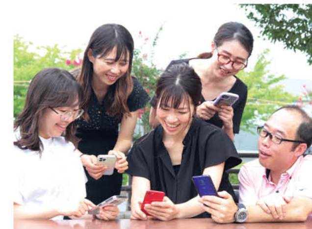
健康づくりが課題に健康アプリを10月導入

町ではウォーキング(歩くこと)を通じた新たな健康マイレージ事業として健康アプリ『おうらてくてくアプリ』の配信を10月1日からスタートします。アプリには健康につながるさまざまなメニューを用意。中でも、地域通貨「コハクペイ」に交換して町内のお店で食事や買い物に使える『おうらてくてくポイント』は、必見です！