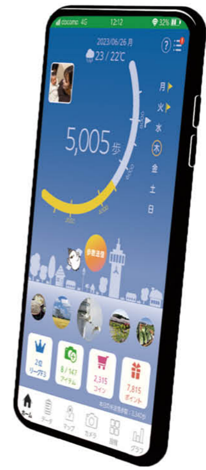
注)画面はいずれも開発中のイメージです。

*ウェアラブル端末……手首や腕、頭などに装着するコンピューターで腕時計型が主流。通知や健康管理など機種によって機能や用途はさまざま。