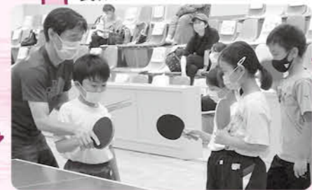
ラケットの持ち方など、基本から教わります

期 7月26日④、27日④、28日④(全3回) 時 午後6時30分～7時30分 場 町民体育館 内 卓球を基礎から学ぶ 対 小学生 定 20人 費 500円(保険代) 申 6月24日④午前10時 問 町民体育館