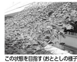
この状態を目指す(おととしの様子)

高島公民館 初夏から秋にかけて皆さんを多くの花がお迎えします 高島公民館南側の駐車場には花壇があり、季節ごとに花を咲かせ皆さんをお迎えします。孫兵衛川沿いの花街道を日頃から管理しているボランティアさんの協力のもと、グラジオラスの球根やたくさんさんの菊、ジャーマンアイリス、グリーンカーテン用の西洋アサガオの苗を春植えしました。初夏から秋にかけて花を咲かせ、これまで