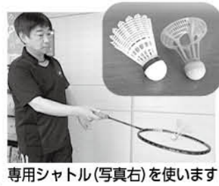
専用シャトル(写真右)を使います

町民体育館 屋外でプレーできる新しいバドミントン!? その名は……「エアバドミントン」! エアバドミントンとは風の影響を受けにくい「エアシャトル」とバドミントンのラケットを使用し、誰でも簡単に楽しむことができる屋外バドミントンです。ルールはバドミントンと同じですが、コートとプレーエリアが変わります。種目はシングルス、ダブルス以外にトリプルスという試合形式があります。プレー場所もハ