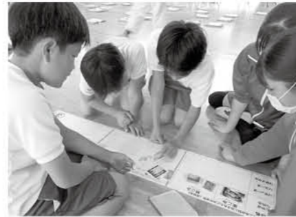
5R(リフューズ、リデュース、リユース、リペア、リサイクル)に分類し、学習中!

SDGsの学習に「エコムーブ号」が大変役立ったようですね。町にもリサイクルステーションが2カ所設置されています。今回学んだ5Rも生かし、活用できるものは再利用し、みんなで協力してゴミを減らしていきたいですね。