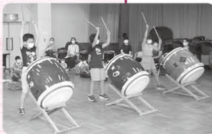
和太鼓の魂である鼓動を呼び覚ませ

期 7月16日④、30日④、8月6日④、27日④、9月3日④(全5回) 時 午前9時30分～11時 場 長柄公民館 内 和太鼓演奏の基礎を学ぶ 対 小学生以上18歳未満の人 定 15人 費 無料 申 6月17日④午前9時 問 長柄公民館