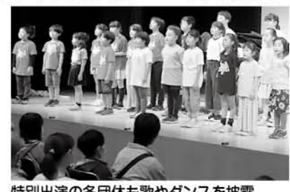
特別出演の各団体も歌やダンスを披露