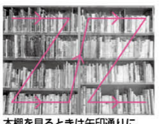
本棚を見るときは矢印通りに

町立図書館 意外と知らない図書館雑字の「本棚にある本の並び方の法則」 本棚の本は背表紙の下に貼ってある請求記号という情報に従って、棚の左から右、上から下へ並んでいます。請求記号は数字とかなで表されています。基本的に数字が小さい順、カタカナのアイウエオ順に並んでいます。大きさによって順番が前後している場合もあります。本の探し方が分からないときは、お気軽に職員に尋ねてくださいね。