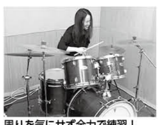
周りを気にせず全力で練習!

中央公民館 音楽室やスタジオで歌や楽器演奏の練習をしよう 中央公民館には音楽室とスタジオがあり、これらの部屋は、楽器の演奏や歌の練習、録音などをするための部屋です。完全防音室となっており、音の漏れや音が入り込まないようになっています。ピアノやドラムセット、マイクやアンプも完備です。音の練習だけでなく、音が入り込まないようになっています。仲間を誘ってみんなでご利用ください。