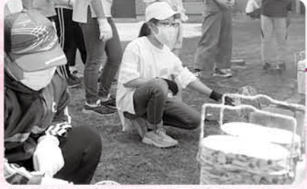
火をおこして自分たちの力で炊飯をしてみよう

期 7月8日④ 時 午前9時～正午 場 中央公民館 内 野外で飯ごう炊飯を体験する 対 町内在住の小学5年生～中学生 定 15人 費 無料 申 6月17日④午前10時 問 中央公民館