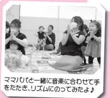
ママリビと一緒に音楽に合わせて手をたたき、リズムにのってみたよ