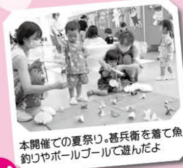
本開催での夏祭り。甚兵衛を着て魚釣りやボールゲームで遊んだよ