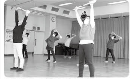
パドルを使って体を大きく動かす

期 5月9日、16日、23日、30日(全4回) 時 午前10時30分～正午 場 長柄公民館 内 全身運動でバランスを整え、手指の運動で脳を活性化させる 対 18歳以上の人 定 15人 費 無料 申 4月18日 午前10時から 問 長柄公民館