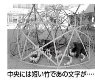
中央には短い竹であの文字が...