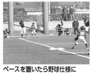
ベースを置いたら野球仕様に

中央公民館 3代目スタードームが華やかにグレードアップを遂げました 昨年の広報おうら12月号で紹介した、3代目スタードーム。このたび、楽竹会の皆さんの手によって、グレードアップしました。竹で作られたまわりや風車などかわいらしい飾りが加わり、デザイン性が増して、見た目も華やかに。丁寧に並べられた短い竹をよく見ると...なじみのある3文字が!まるでかぐや姫の世界にいるような、そんな気分が味わえるかも。外を歩くにも、気持ちの良い季節になってきたので、ぜひ立ち寄ってご覧ください!