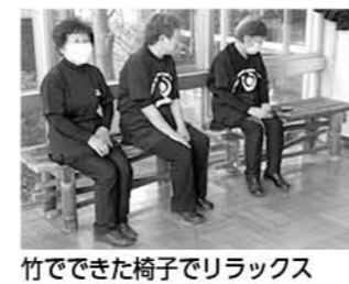
竹でできた椅子でリラックス