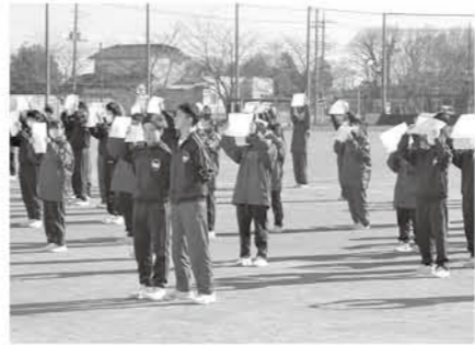
1人1枚紙を持ち、2階にいる3年生に思いを伝える

在校生の感謝と応援の気持ちがしっかりと伝わり、卒業生は胸を張って巣立っていきました。邑楽中学校の新たな伝統になりましたね。全校生徒の気持ちが1つにまとまり、卒業生へ思いが届く瞬間がとても感動的です！