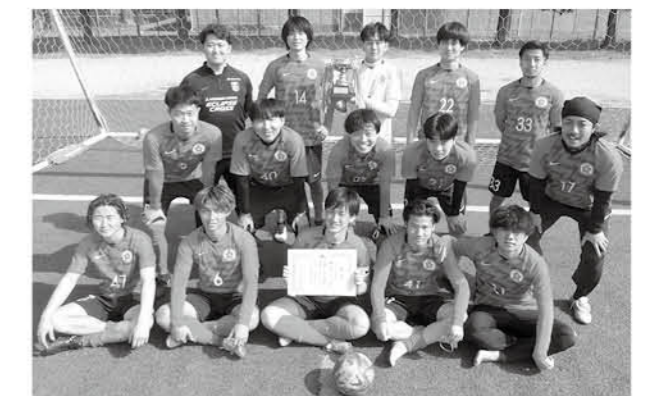
優勝 リバティ館林 準優勝 ブラックおおたん 第3位 誰でもどうぞ、オレンジパイキー

3月5日、12日邑楽町スポーツ・レクリエーション広場にて第30回邑楽町長杯争奪サッカー大会が開催されました。