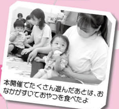
本開催でたくさん遊んだあとは、おなかがいっぱいおやつを食べたよ