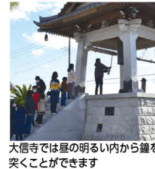
大信寺では昼の明るい内から鐘を突くことができます