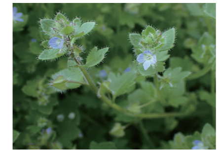
空き地を席巻するフラサバソウ

私たちの生活にとって、自然との関わりは切っても切れない重要なものです。自然は水・空気・土地が重要でそのいずれもが欠けても私たちは健康に生きていけません。人々の往来が激しくなると自然がかく乱され、意図的あるいは非意図的に地域外や外国から侵入し定着した植物群があります。以前は帰化植物と呼ばれていましたが最近では外来植物といわれています。日本で見つかっている外来植物は分かっているだけで、1,200＋種を超えます。オオイヌノフグリはオオバコ科ク