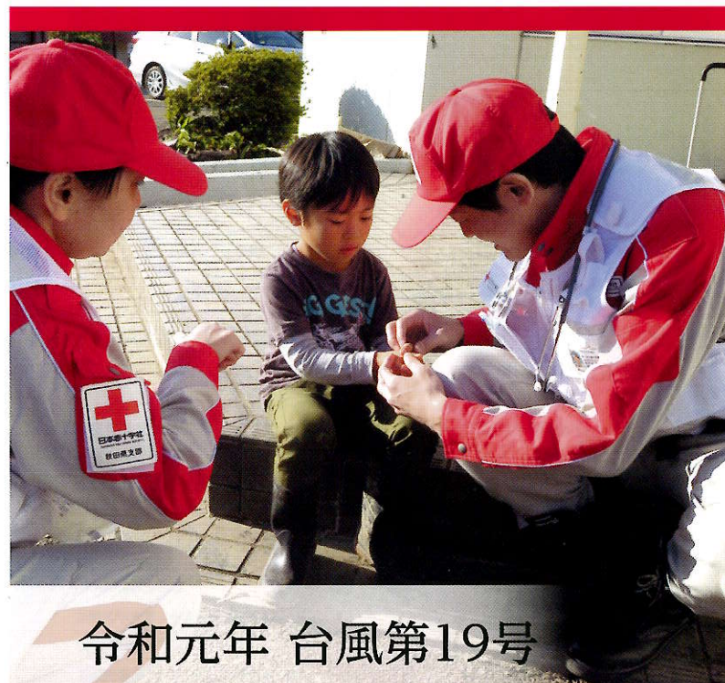
令和元年 台風第19号