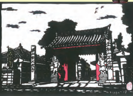
↑⑦大信寺【布袋尊】 大信寺は、太平記に新田義貞の家臣として新田四天王と呼ばれた篠塚伊賀守菩提所である