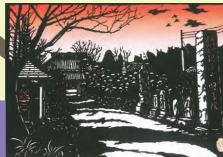
→④明王院【福祿寿】 明治の大水害を教訓に住民が浄財を出し合い造船した揚船がある