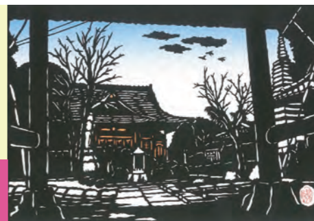
→恩林寺には樹高28mのイチヨウと、幹周り4mのケヤキの巨木がある