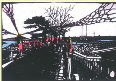
↑③浮島弁財天【弁財天】 多々良沼公園内にある弁財天（守護は恩林寺）