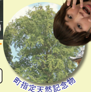
町指定天然記念物