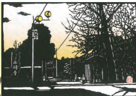
←②永明寺【寿老人】 永明寺のキンモクセイは元弘元年（1331）夢窓国師（むそうこくし）お手植えと伝えられ、樹齢は約700年（国指定天然記念物）