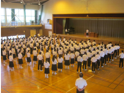
校歌斉唱(始業式)の様子

生徒たちの元気な声が教室に戻ってきました。嬉しい限りです。2学期も1つでも多くの笑顔が見られるように、生徒と教職員、保護者が一体となって「邑楽南中でよかったと心から思える学校づくり」を進めていきたいと思ひます。より一層のご理解、ご協力をよろしくお願いいたします。