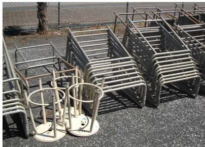
<古いイスや机は材料によって分けました>