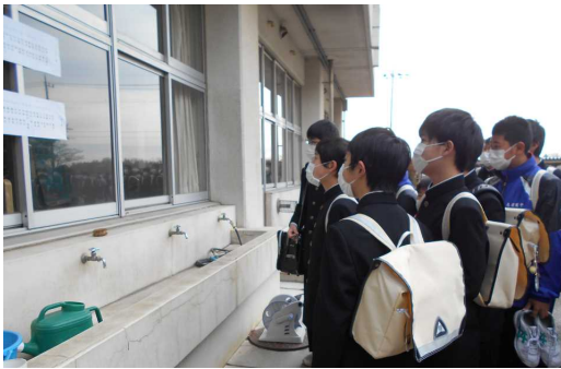
<新クラス掲示を心配そうに確認>

残念ながら多くの学校行事や部活動の大会が中止や変更になってしまいました。そして、これからまた第2波や第3波が来て、再び休業になる可能性もあります。