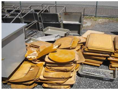
<カ自慢の先生も悪戦苦闘しながら作業していました>