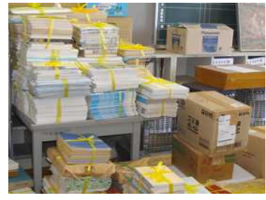
<古い本や資料もきれいに整理されました>

また、生徒の皆さんが安心して学習できるよう、3密を避けながら日頃手の届かない場所を掃除したり消毒したりする職員作業日を数日設定しました。生徒に会えない、授業ができないストレス(!?)を大きな力に変えて、どの先生も本当に協力して生徒の皆さんが気持ちよく学習できる環境づくりに汗を流していました。