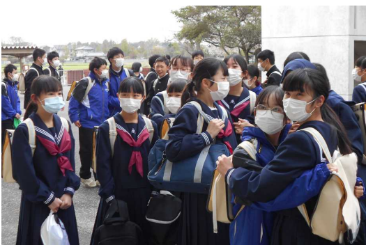
<自分の名前を見つけて思わず抱きつく>

見通しをもちにくい1年ですが、私たち教職員は、生徒の不安や心配に寄り添い、できることを生徒と一緒に探しながら、共に笑顔で過ごせる時間を大切にしていきたいと思っております。