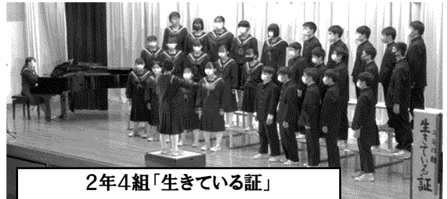
2年4組「生きている証」