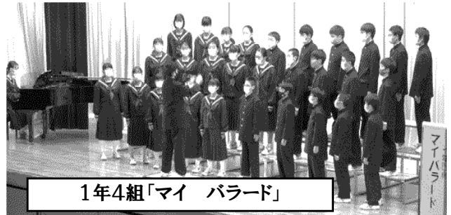
1年4組「マイ パラード」