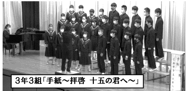
3年3組「手紙～拝啓 十五の君へ～」