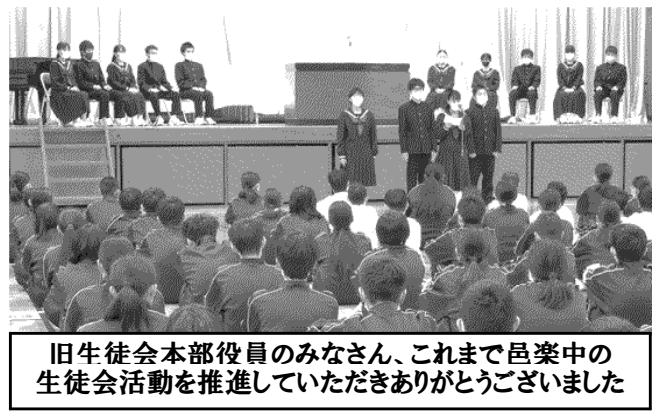
旧生徒会本部役員のみなさん、これまで邑楽中の生徒会活動を推進していただきありがとうございました