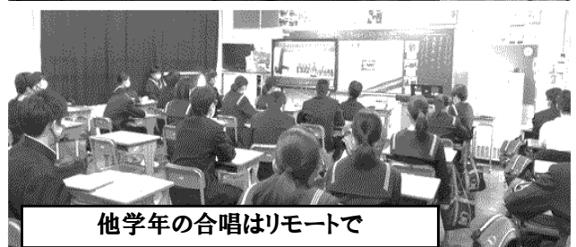
他学年の合唱はリモートで