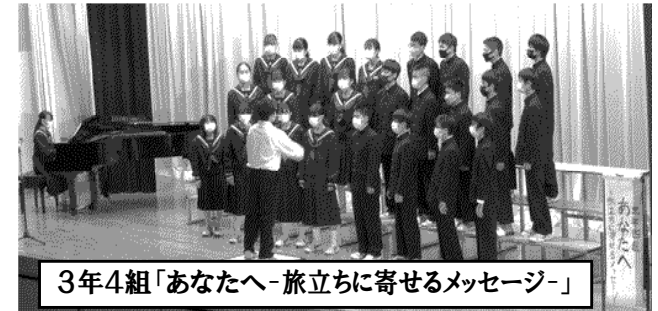
3年4組「あなたへ-旅立ちに寄せるメッセージ-」