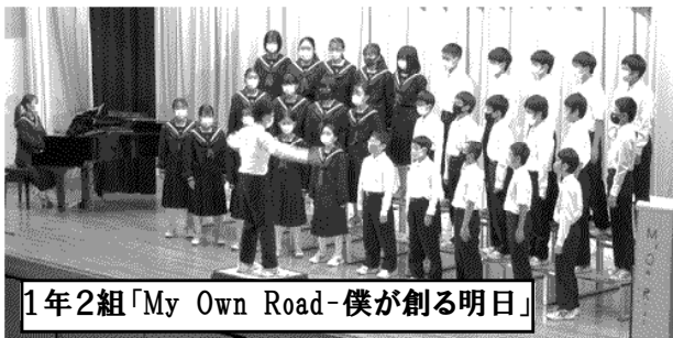
1年2組「My Own Road-僕が創る明日」