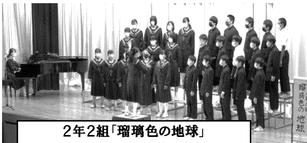
2年2組「瑠璃色の地球」