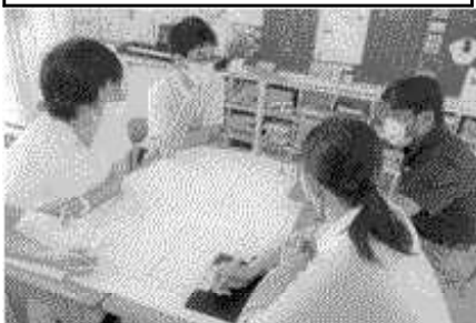
グループ内での熱い議論