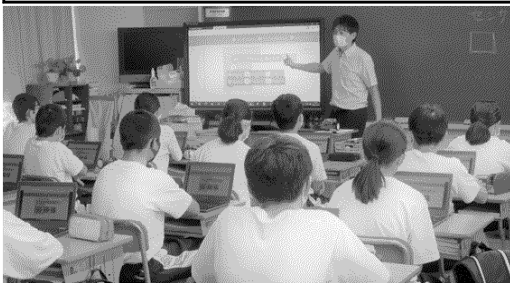
制御プログラムやプログラミングの説明