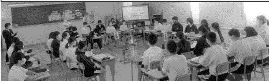
（議長団は↓この辺りです）