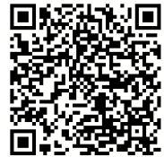
邑楽町防災マップ (ハザードマップ)

5月16日(火)、全校集会で「水難時の対応」について学びました。台風や活発化した梅雨前線、ゲリラ豪雨・・・近年水害が激甚化しています。想定内に対しては確実に対応し、想定外の時には身を守る行動をとることが必要です。その第一歩として、自分の家や地域の実態を把握しておく必要があります。右のQRコードから「邑楽町防災マップ」をご覧ください。 「我が家は」「避難場所は」「家族との合流場所は」「連絡手段は」をご家族で話し合っておくとよいでしょう。