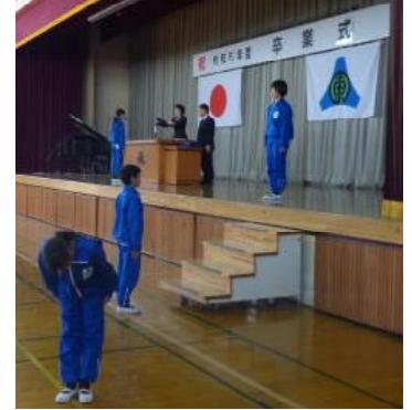
【卒業式予行での証書授与】

保護者の皆様には、6年間の長きに渡り、本校の教育活動に温かいご支援とご協力をいただき、感謝いたします。今後も、地域の一員として、本校を見守っていただければ幸いです。