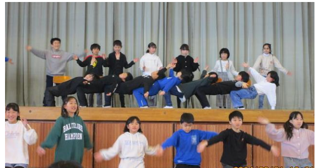
【4年：きっとだいじょうぶ】↑ ダンスが上手で、本当の劇団のようでした！