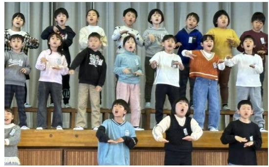
【2年：ビリーブ】↑ 歌も手話も、とっても上手でした！