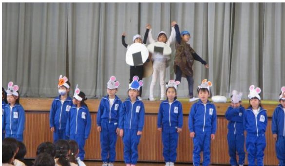
【1年：おむすびころりん中野東小バージョン】 「チュー」が、とってもかわいかったです！