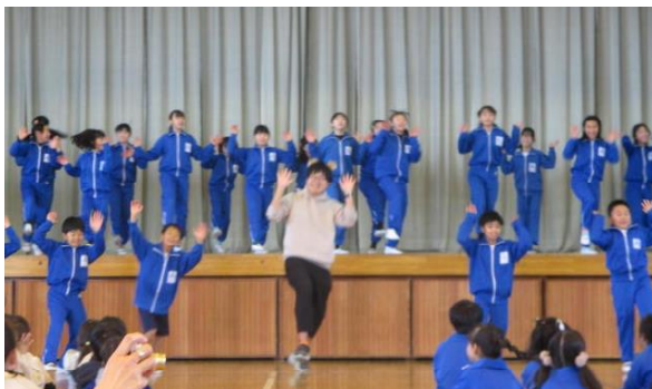
【5年：THE ダンス】 レベルの高いダンスで、会場を盛り上げてくれました！