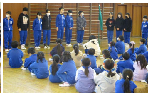
【6年生より下級生へあいさつ】