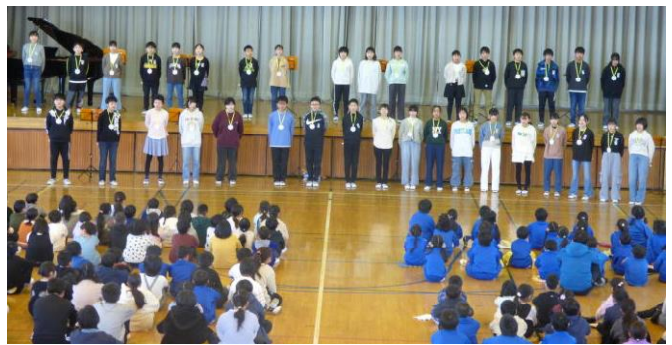
【6年：6年生からのお礼】↑ しっとりした、「春よ来い」と「いのちの歌」は、会場全員の心にしみました。