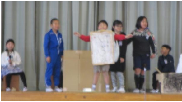
【3年：すがたを変えるだいでず】↑ だいでずについて、とても勉強になりました！