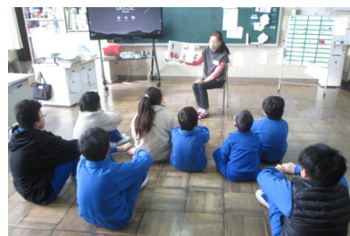
【ひがし学級での読み聞かせ】

2月28日(水)の朝行事の時間、読み聞かせがありました。今年度は学期に1回でしたが、来年度は学期に2回になる予定です。ユーカリの会の皆様、子どもたちのために、いつも色々なお話を聞かせていただき、ありがとうございます。子どもたちの心の栄養になりました。来年度もよろしくお願いいたします。