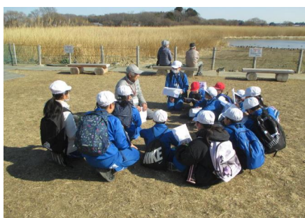
【ガバ沼での白鳥のお話】