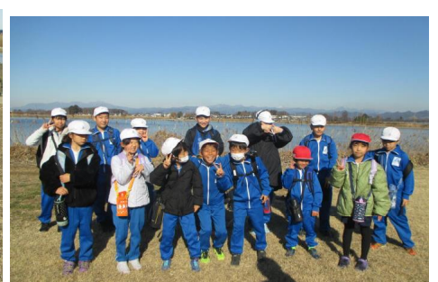
【野鳥観察場での記念撮影】