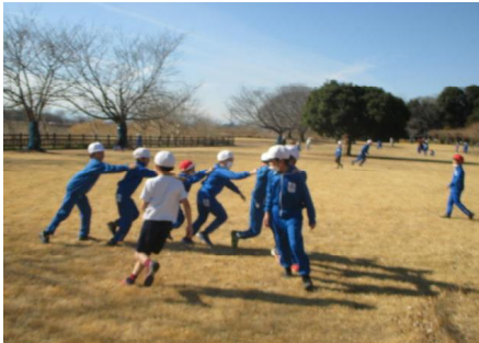
【多々良沼公園での班遊び】