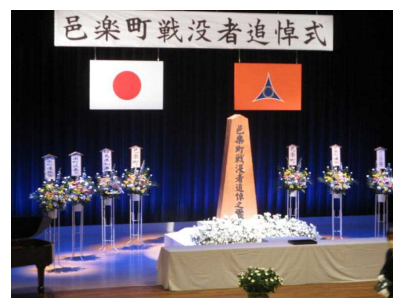
【邑の森ホールの式場】

式辞や追悼の辞の中で、戦争の恐ろしさと平和の尊さ、平和への道のりはまだ遠いことなどが話されました。悲しい歴史をくり返さないためにも、私たち戦争を知らない世代が正しく学び、引き継いでいくことの大切さを改めて痛感しました。