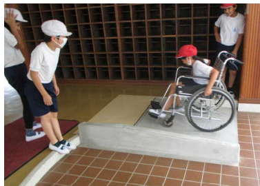
【スロープは後ろ向きで】