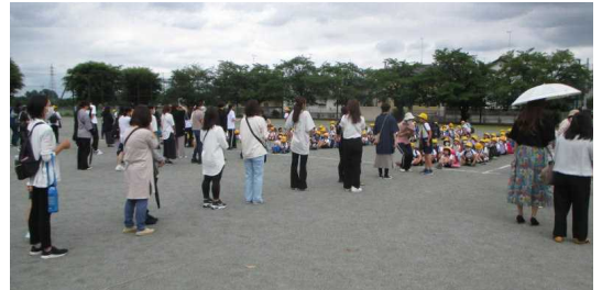
【校庭での引き渡し訓練】

続いて、地震対策引き渡し訓練が行われました。保護者やご家族の方に、一人一人確認しながら、確実に子どもたちを引き渡すことができました。お忙しい中ご協力いただいた保護者等の皆様、ありがとうございました。