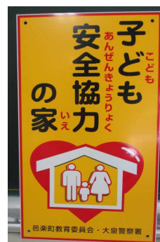
【この看板が目印です】

お忙しい中、対応してくださった「子ども安全協力の家」のみなさん、ありがとうございました。引き続き、どうぞよろしくお願いいたします。