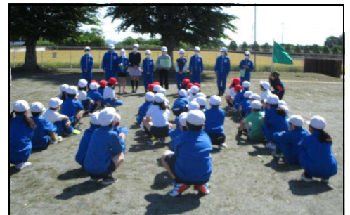
【班長の紹介とあいさつ】

活動を通して、各班、そして、各団の間との友情、絆を深めてほしいと思います。1年間、よろしくお祈いします。