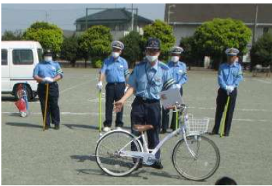
【乗り方と点検の説明】

指導して下さった7名の皆さん、そして、自転車を持ってきてくれた児童の皆さん、ありがとうございました。そして、3年生以上の皆さん、自転車の安全運転をお願いします。