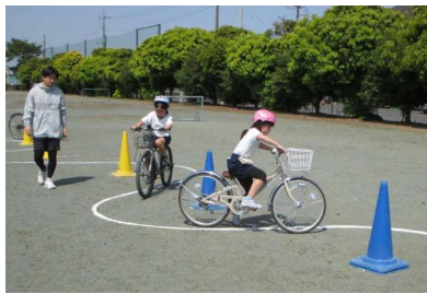
【スラロームの練習】

ぶ : ブレーキ た : タイヤ は : ハンドル・反射材 しゃ : 車体 べる : ベル