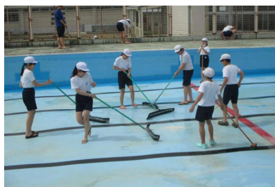
【一生懸命プール清掃する6年生】

5月25日（木）の5，6校時、6年生によるプール清掃が行われました。デッキブラシやたわしを使ってプールの底や壁を磨いたり、側溝の落ち葉や泥を取り除いたりしてくれました。これで、全校児童が気持ちよく水泳の学習ができます。6年生のみなさん、ありがとうございました。