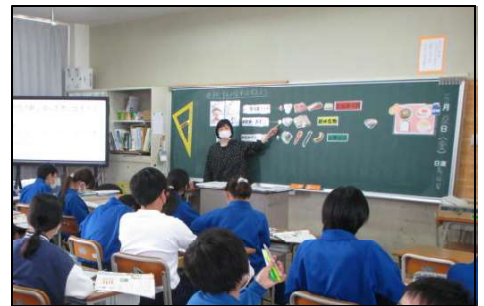
【6年1組での食育授業】

朝ご飯をしっかりと食べて、3つのスイッチをオンにして、毎日元気に学習活動に取り組んでほしいと思います。