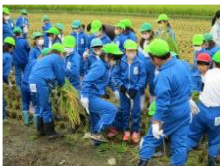
3・4・5年生 稲刈り体験