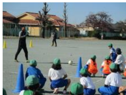
全校 ザスバクツサッカー教室