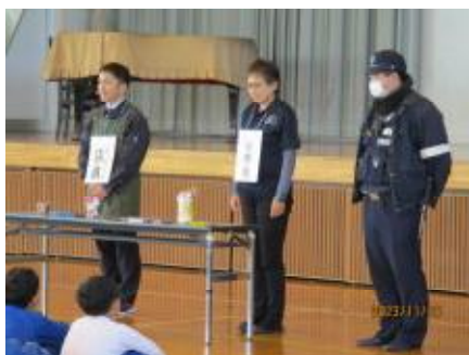
1・2・3・4年生 万引き防止教室