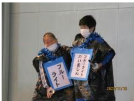
全校 児童集会(保健委員会)