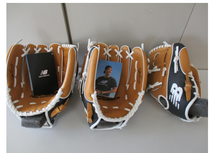
大谷選手からのプレゼント